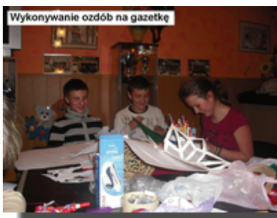
Wykonywanie ozdób na gazetkę