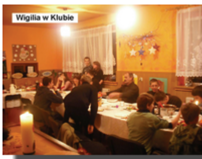
Wigilia w Klubie