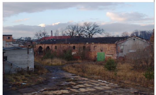
Budynek fabryki Koulhaassa na terenie KZCP