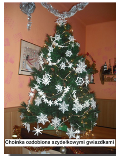
Choinka ozdobiona szydełkowymi gwiazdkami